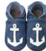
Anker auf dunkelblau