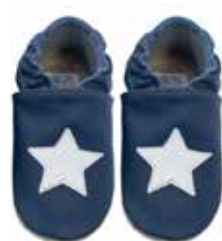
blau Stern weiß