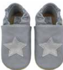
grau Stern silber