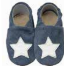
blau mit weißem Stern