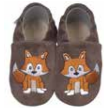
Fuchs dunkelbraun K