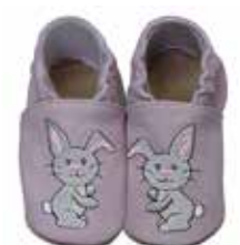
Hase pastell lila