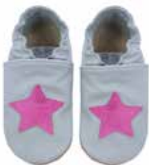
grau Stern pink