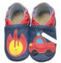
Feuerwehr mit Feuer