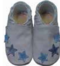
grau mit blauen Sternchen