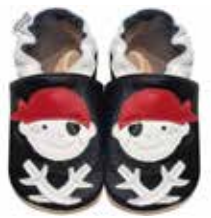
Pirat Jack schwarz