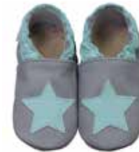
dunkelgrau mit mint Stern