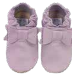
Schleife pastell lila